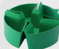
Coletor de óleo