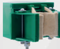
Lubrificador de guias