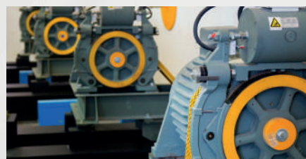
Máquina de Ímã Permanente