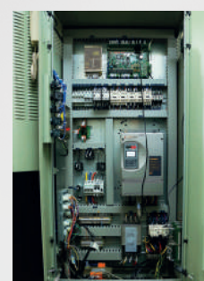
Quadro de comando computadorizado